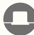
CUT IN SPEAKER