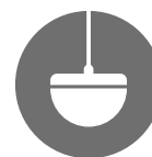
zavěšený reproduktor I