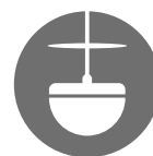
zavěšený reproduktor II